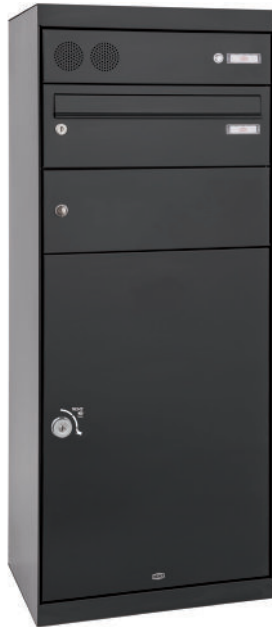
QUBO XL mit Briefkasten & Sprech-/Klingel

RAL 7016, Farbdarstellung kann abweichen