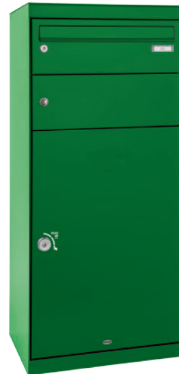
QUBO XL mit Briefkasten

RAL 7016, Farbdarstellung kann abweichen